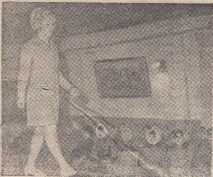
Показ новых мод.